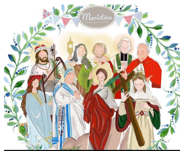
Feliz día de todos los Santos

En el Día de Todos los Santos , estamos obligados a asistir a Misa para alabar y adorar a Dios y honrar la vida de los santos.