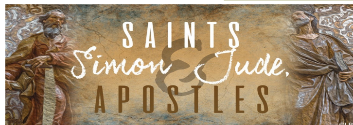
Festividad el 28 de octubre

Si le gusto la muestra de sopa, por favor, haga su orden ($10.00) y traiga en un sobre sellado y entregue a los Caballeros de Colón. :)