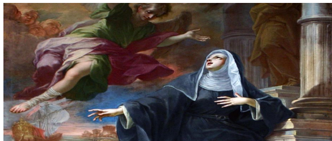
Santa Monica, festejo el 27 de agosto